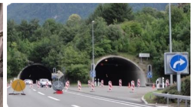
Verkehrsumleitung bei der Instandsetzung Murg-Walenstadt