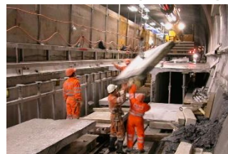
Bauausführung Tunnel San Bernadino