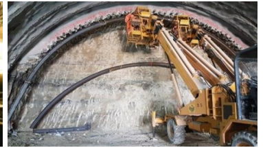
Neubau 3. Röhre Gubrist