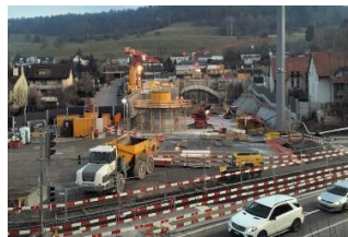
Neubau 3. Röhre Gubrist