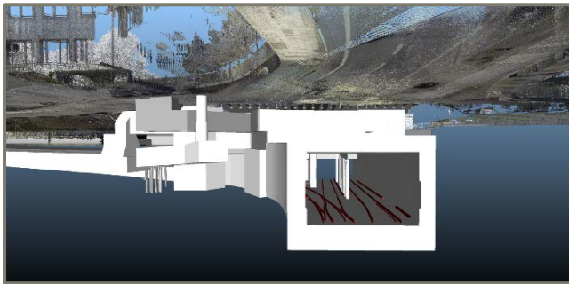
■ Bestandsmodell, Anschlussstelle