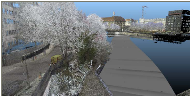
■ Oberfläche (DGM) + Lage Bestandsstunnel